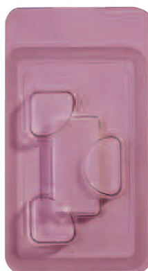
מס' קטלוגי 101 תחבושות CollaCote ס"מ 3.8X1.9