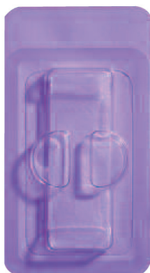
מס' קטלוגי 100 תחבושות CollaTape ס"מ 2.5X7.5

תחבושות נספגות מקולגן מסופקות באריזות סטריליות נפרדות. בקונפיגורציות הבאות: