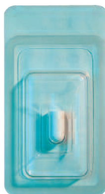
מס' קטלוגי 102 תחבושות CollaPlug ס"מ 1.9X1.0